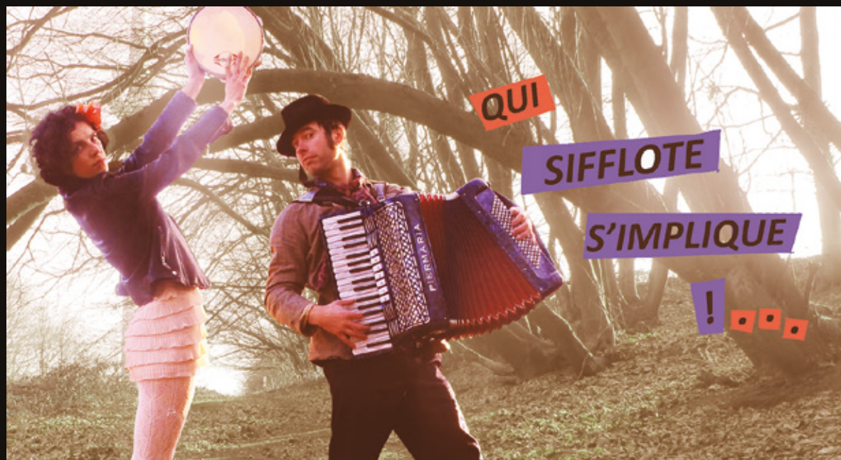
Illustration : Rémi Hochedez

www.inillotempore.net/ qui-siffle-simplique odilediffusion@gmail.com